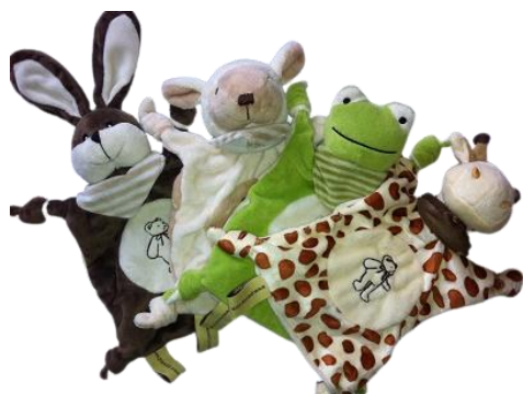
Doudou choix aléatoire