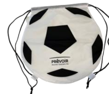
Sac à dos ballon de foot