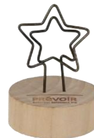
Clip photo Noël