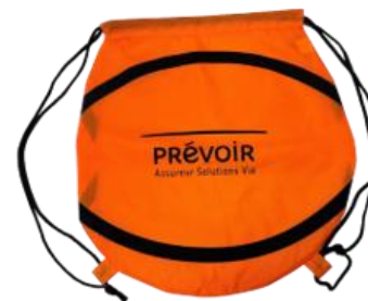
Sac à dos ballon de basket