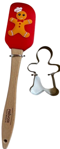
Spatule et emporte pièce petit biscuit