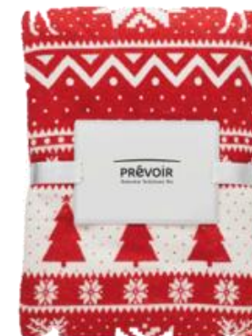
Plaid de Noël