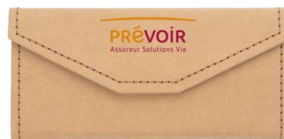
Etui à lunettes