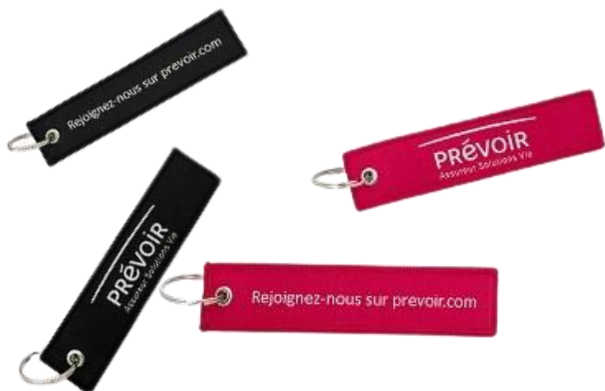
Porte clé flamme framboise ou noir