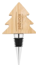
Bouchon de bouteille sapin