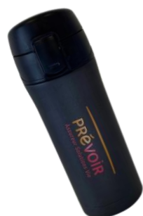
Mug isotherme avec cadenas