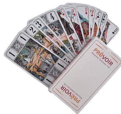
Jeu de tarot