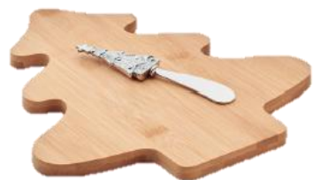
Planche à fromages