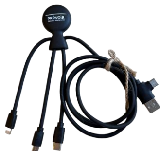
Câble Mr Bio