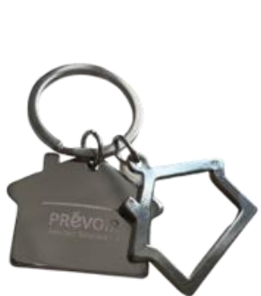
Porte clé maison