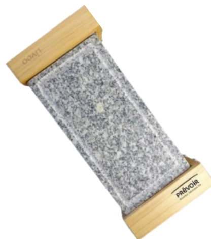
Appareil à raclette