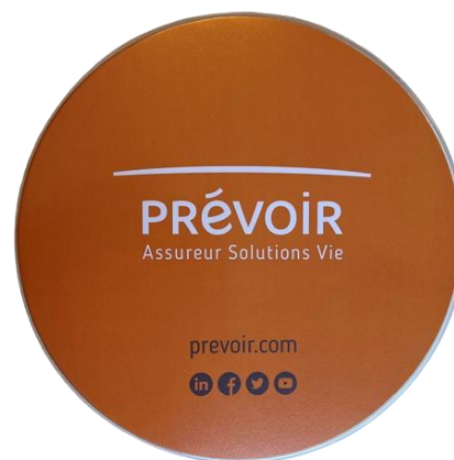
Tapis de souris